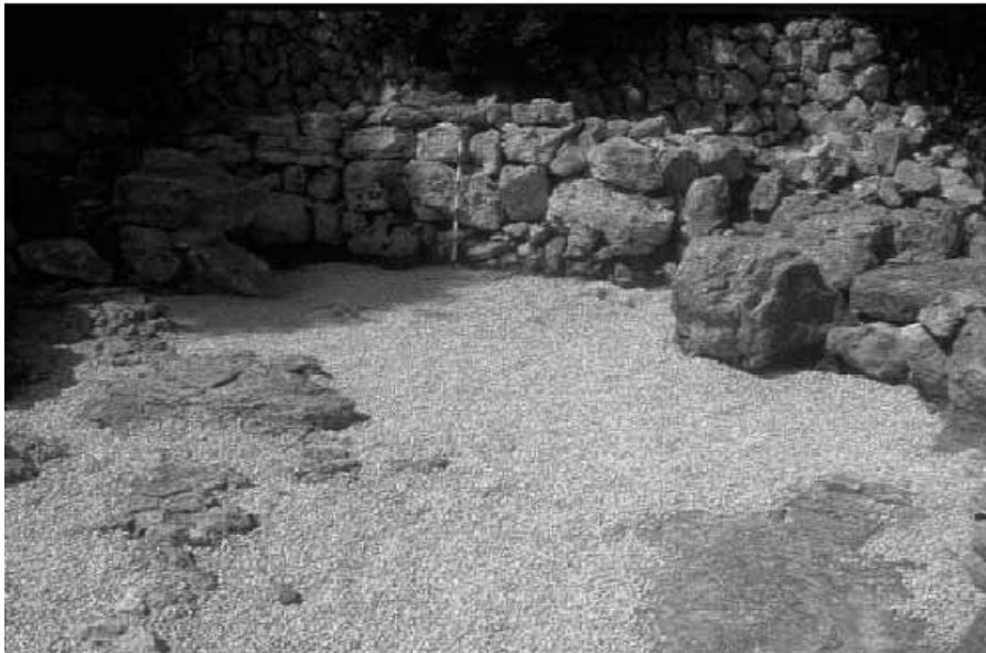
Habitació E del recinte adossat al talaiot quadrat.