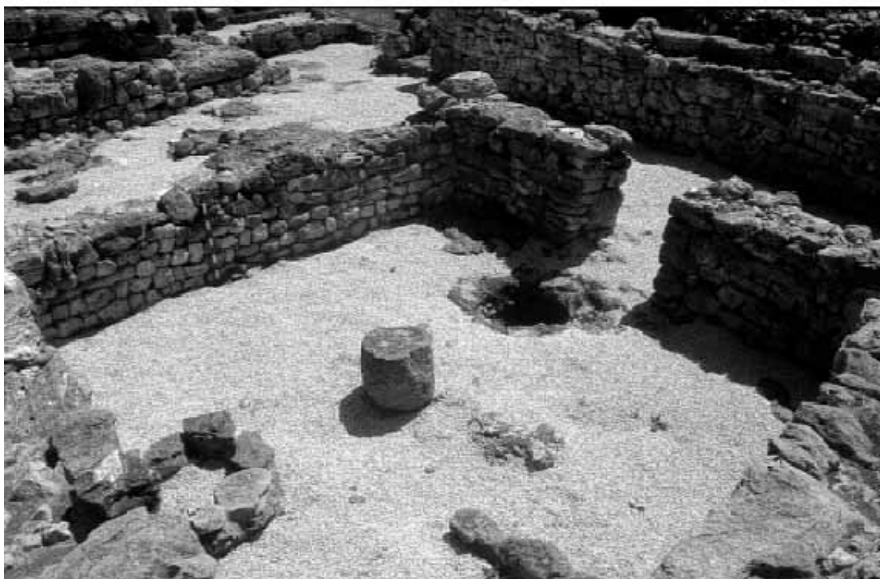
Habitació B del recinte quadrangular