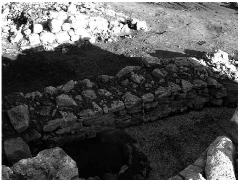
FET 3. Vista del mur associat al talaiot quadrat.