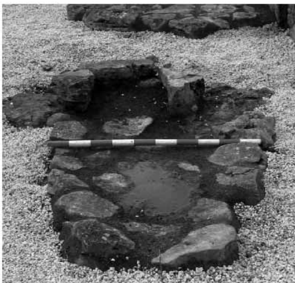
Detall de la llar de foc del naviforme I.